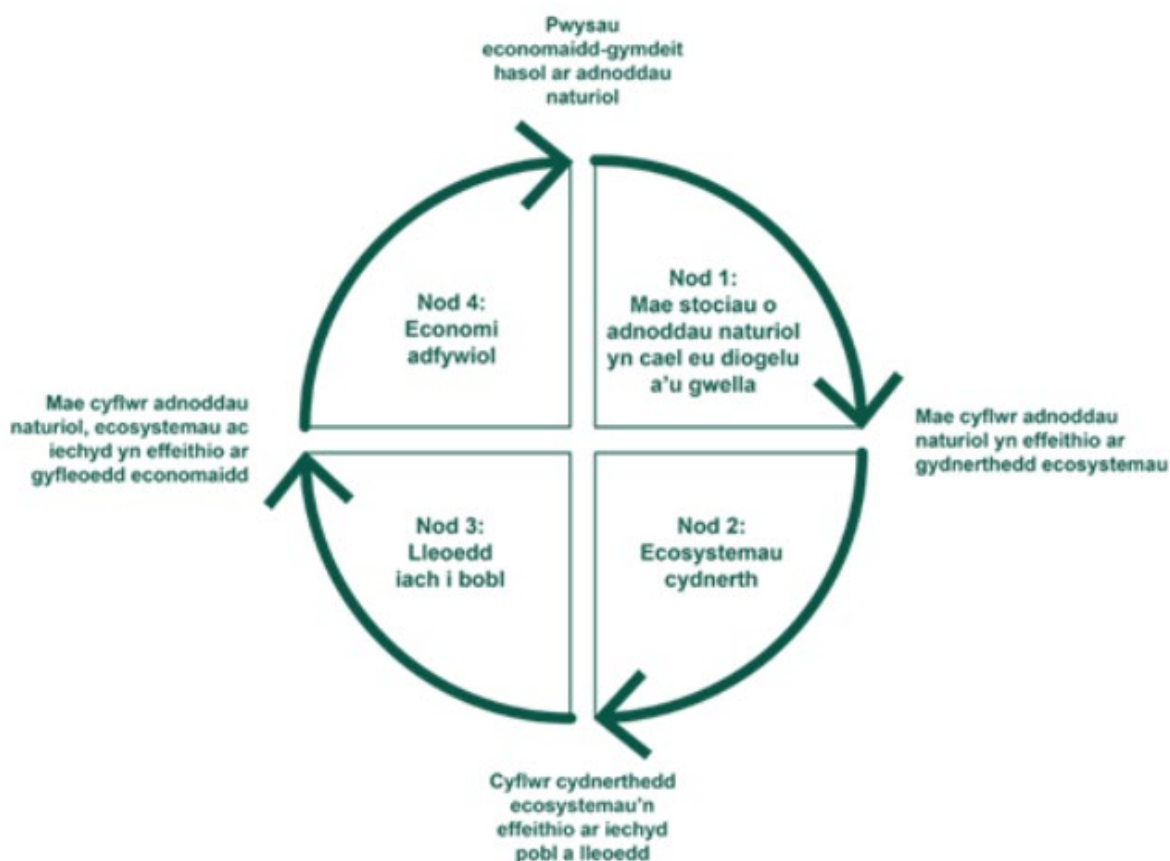
Ffigur 1: Diagram SoNaRR2020 Cyfoeth Naturiol Cymru yn dangos y cysylltiadau a natur gylchol y pedwar nod o reoli adnoddau naturiol yn gynaliadwy (SMNR).

Mae'r Adroddiad o Gyflwr Adnoddau Naturiol 2020 (SoNaRR2020) gan Cyfoeth Naturiol Cymru yn amlinellu lle'r ydym ni fel cenedl a lle mae angen inni fod â chanllawiau ar sut i 'gau'r bwllch' i hyrwyddo bioamrywiaeth ac annog cydnerthed ecosystemau. Mae gwybodaeth o'r adroddiad hwn yn rhoi cyd-destun ac arweiniad i gynllun CTM. Mae SoNaRR2020 yn ystyried sut rydym yn y sefyllfa orau i reoli adnoddau naturiol yn gynaliadwy (SMNR) drwy 4 nod hirdymor: